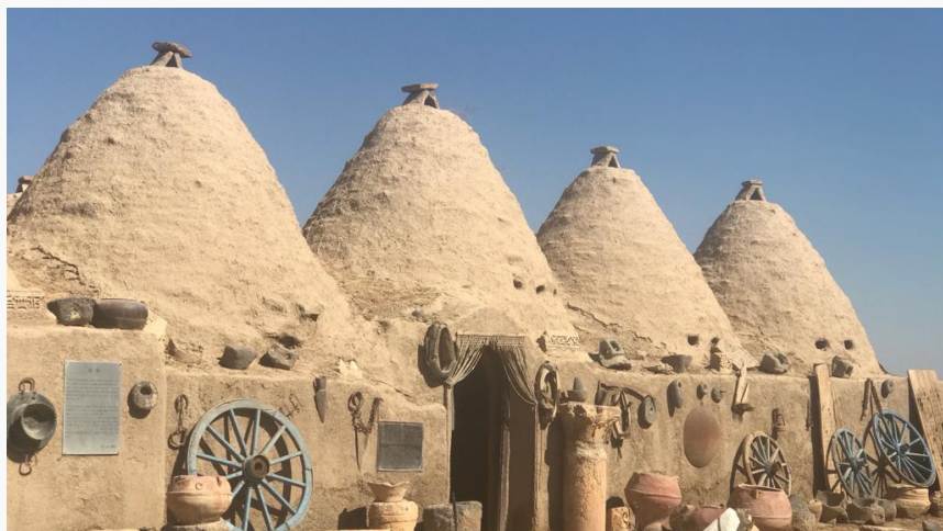
HARRAN - TURCHIA