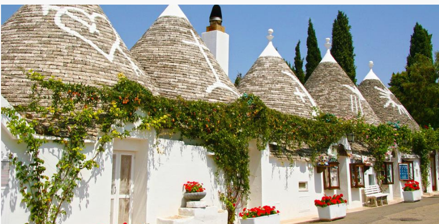
ALBEROBELLO - ITALIA

Inoltre, far parte di questo progetto mi ha regalato l'occasione di immergermi completamente nelle società turca e siriana. Giorno per giorno imparavamo nuove parole di cortesia in turco e in arabo, iniziando a diventare parole d'uso comune anche tra noi volontari. Con quelle poche parole apprese, cercavamo di interagire con la gente del posto la quale ci facevano sentire sempre i benvenuti a Gaziantep.